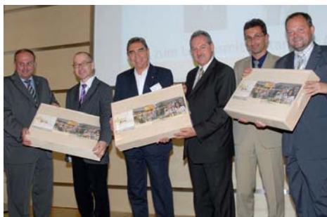
Die öö. Genussbox wurde als Dankeschön an die Referenten überreicht.