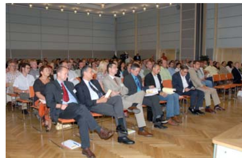
Rund 220 Teilnehmer folgten gespannt den interessanten Vorträgen.