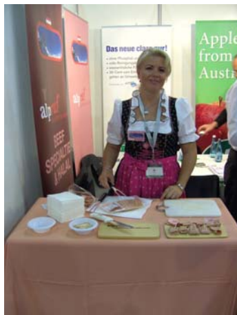
Österreichische Schmankerl auf einer Messe in Dubai.

Um auch für österreichische Qualitätsbetriebe und deren qualitativ hochwertige und einzigartige Produktportfolios den internationalen Markteintritt attraktiver und vor allem möglich zu machen, haben sich die LC-Partner Moser & Co. Ges.m.b.H., Hütthaler KG, Reiter Fleischwaren sowie die Unternehmen alpruf Handels-GesmbH und Anton Haubenberger GesmbH zu diesem Kooperationsprojekt zusammengeschlossen.