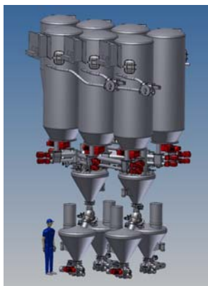
Das NEUE Dosier-/Wägemodul "HI CapAcc24"

Das österreichische Anlagenbau-Unternehmen AMMAG ist auf Wirbelschicht-Sprühgranulation und Schüttgut-Handling (Förder-, Silo-, BigBag-, Dosier- Misch- und Wäganlagen für pulverförmige Rohstoffe) spezialisiert.