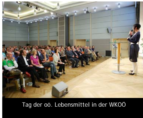
Tag der oö. Lebensmittel in der WKOÖ