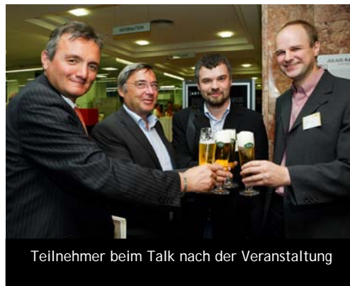
Teilnehmer beim Talk nach der Veranstaltung