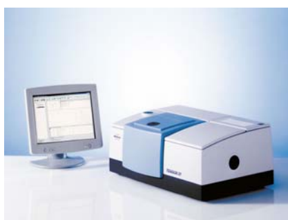
Bruker FT-Infrarotspektrometer Modell Tensor 27

Derzeit werden Lebensmittel wie Honig und Mehle entsprechend den einschlägigen Normen untersucht. Diese garantieren eine gute Vergleichbarkeit (wichtig für Ringversuche), bedingen aber einen hohen Zeitaufwand. Die Schwankungen der Produktqualität bedingen ein hohes Maß an Flexibilität bei der Produktion und unter Umständen auch einen verstärkten Personaleinsatz. Deshalb haben sich der OÖ. Landesverband für Bienenzucht, die Josef Manner & Comp. AG sowie die PROFACTOR GmbH zu einem vom Land OÖ geförderten Kooperationsprojekt zusammengeschlossen. Ziel ist es, ausgewählte Parameter bei der Qualitätskontrolle von Honig, Mehl und Zucker mit Hilfe einer neuen schnellen Methode, die auf Infrarot- bzw Nahinfrarot-Spektroskopie und anschließender chemometrischer Auswertung (multivariate Datenanalyse nach der PLS-Methode) beruht, zu bestimmen.