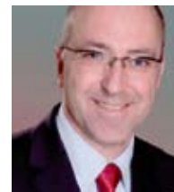
Autor: Josef Berner

unbekannte neue Dimension - vielleicht eine Vierte - in Ihren Köpfen zuzulassen.